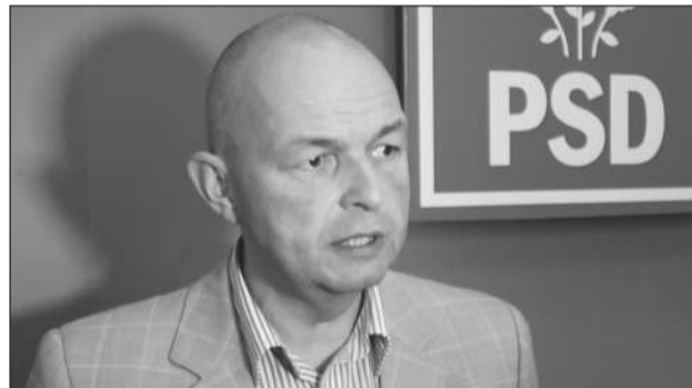
2002 va fi înlocuit cu unul foarte performant. Despre acceleratul liniar de par-

Mai mult, senatorul PSD Florin Orțan va cere ca această vechime să se calculeze și retroactiv. „ Intenționez ca pe parcursul acestei sesiuni parlamentare să depun un amendament la Legea Pensiiilor astfel încât colegilor mei medici, care au lucrat la fel ca și polițiștii sau cadrele din armată, la foc continuu, să le fie recunoscut efortul ”, a menționat senatorul PSD, Florin Orțan. M.S.