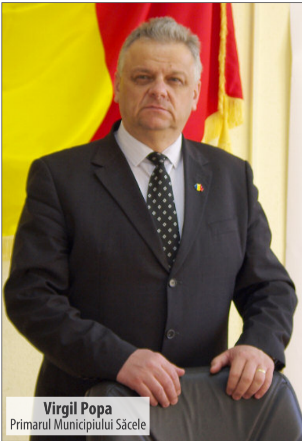
Virgil Popa Primarul Municipiului Săcele