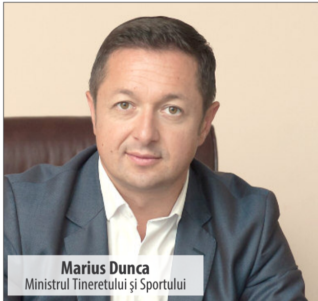
Marius Dunca Ministrul Tineretului și Sportului

Tot în 2017, PSD susține că va termina studiile de fe-