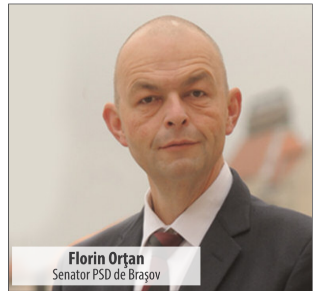
Florin Orțan Senator PSD de Brașov