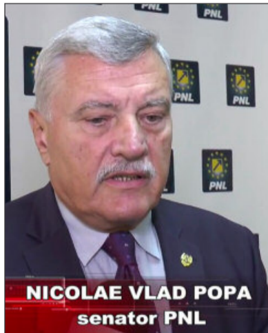
NICOLAE VLAD POPA senator PNL

modificarea Legii privind transmiterea unei suprafețe de teren din domeniul public al statului și din administrarea Institutului Național de Cercetare - Dezvoltare pentru Cartof și Sfeclă de Zahăr Brașov, în domeniul public al Județului Brașov și în admi-